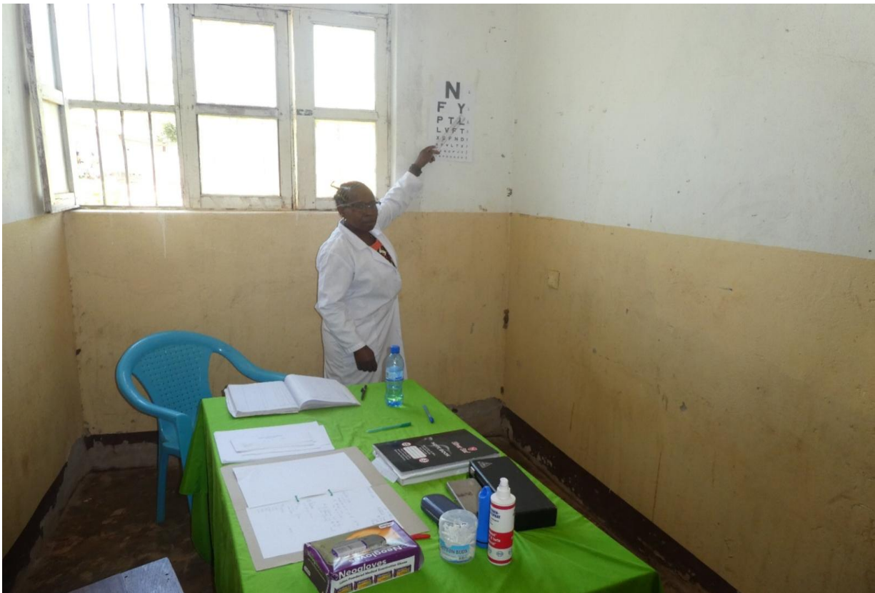
Zur Feststellung ob Patienten eine Sehhilfe benötigen wurde man gebeten die Buchstaben vorzulesen

Doch nicht nur zur Patientenbehandlung kamen die Ärzte in die Kliniken, sondern auch um den Kollegen Empfehlungen auszusprechen und bei schwierigen Patienten Ratschläge zu geben. So wurden oftmals Patienten vorgestellt und gemeinsame Entscheidungen zur Weiterbehandlung getroffen oder noch vor Ort ein Eingriff vorgenommen. Durch die kostenlose Behandlung und Vorsorgeuntersuchungen kann bereits vielen Menschen in der Ruvuma Region geholfen werden. So ist das Konzept der mobilen Klinik eine wirkliche Hilfe für die Menschen die sonst kein Geld für eine Behandlung oder Untersuchung haben.