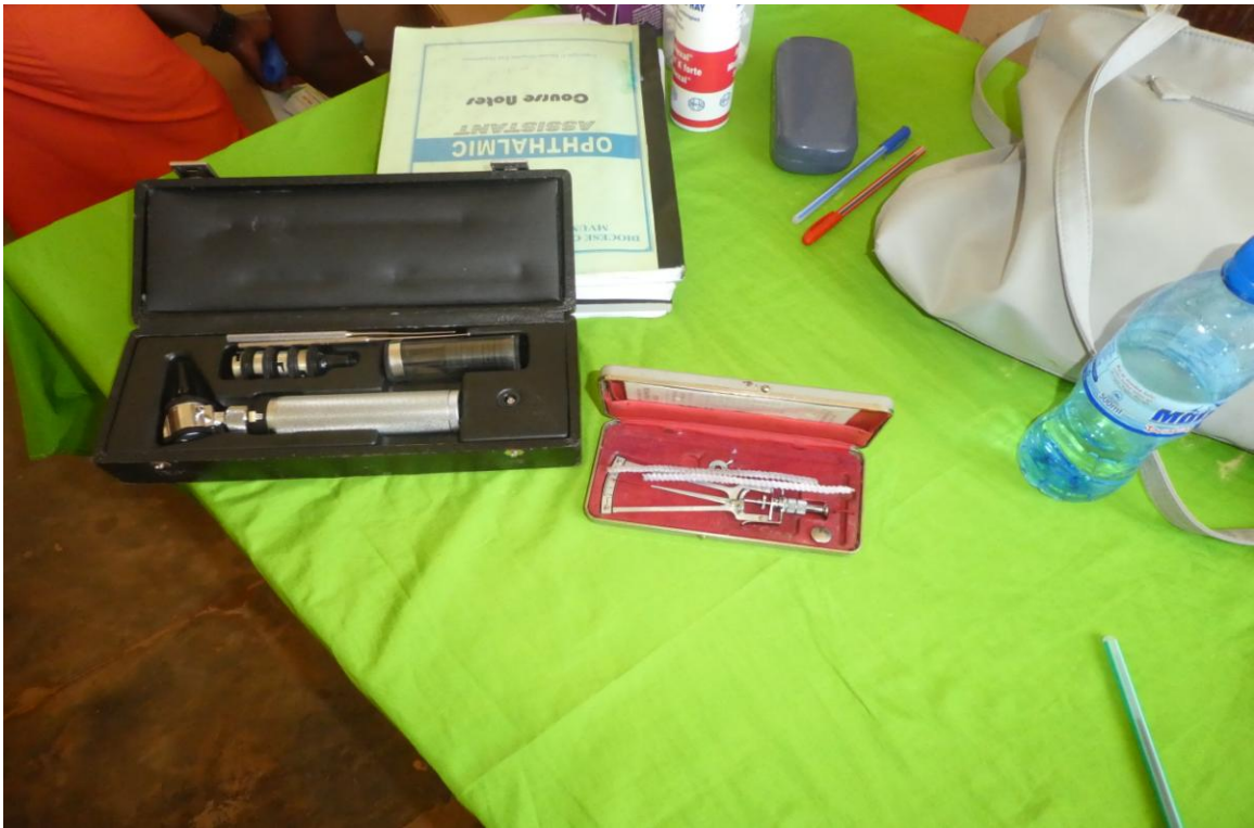
Die Instrumente zur Untersuchung und Bestimmung des Auges und dessen Innendrucks