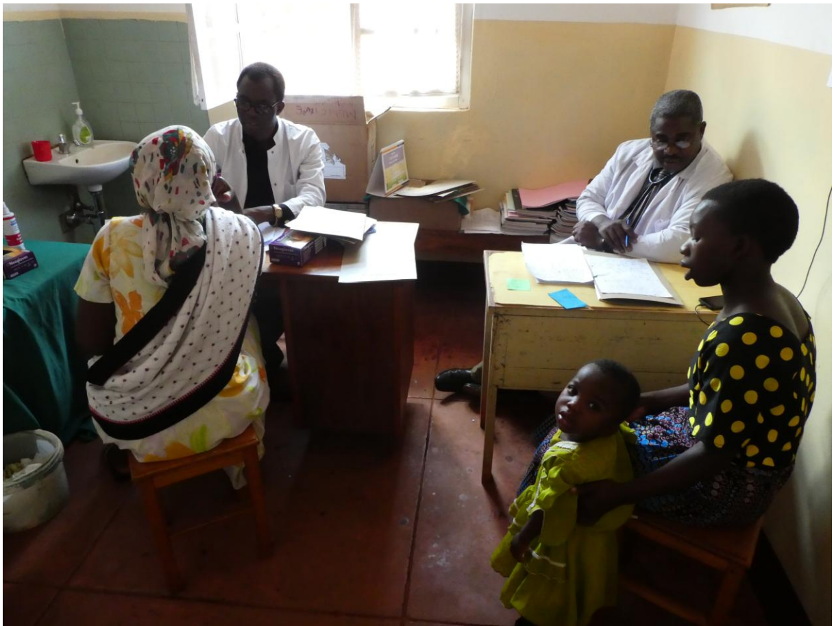
Die Internisten bei einem Anamnese- und Aufklärungsgespräch