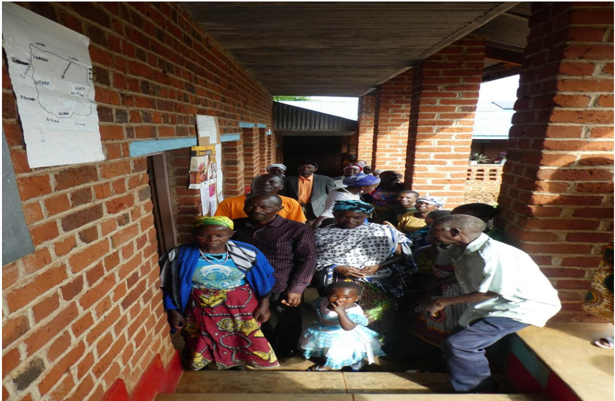
Patienten die auf ihre Untersuchung warten.