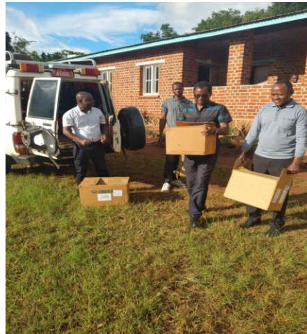
Mobiles Klinikteam in Lundumato

Mpepai Gesundheitszentrum: Der erste Tag unserer Reise sollte auf dieser Station stattfinden, aber aus Gründen, die außerhalb der Möglichkeiten des Teams lagen konnten wir es nicht schaffen, zu dieser Station zu fahren. Der Hauptgrund war, dass es bis zum Morgen des geplanten Termins 72 Stunden lang ununterbrochen geregnet hat. In dieser Situation wurden wir von unseren Gastgebern gewarnt oder benachrichtigt, dass wir es nicht schaffen könnten, dorthin zu gelangen. Die Straße war sehr schlecht und mit viel Schlamm bedeckt. Außerdem sagten sie uns voraus, dass wir an diesem Tag nicht viele Patienten erreichen könnten, da sie in der Umgebung dieser Gesundheitseinrichtung ausschließlich auf Motorrädern (Pikipiki) als Haupttransportmittel angewiesen sind.